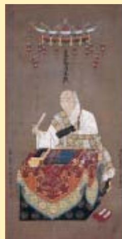
①「萩芒図屏風」内右隻 長谷川等伯 京都市・相國寺承天閣美術館蔵 ②「寒江渡舟図」長谷川信春（等伯） 個人蔵 ③重要文化財「日堯上人像」長谷川信春（等伯） 京都市・本法寺蔵