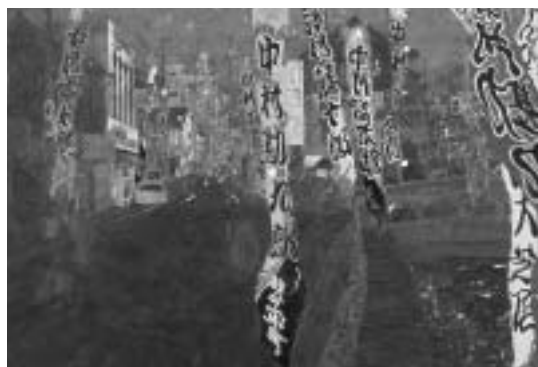
「芝居が来た」 平成5年(1993)