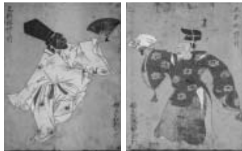
七尾市指定文化財 「絵社三番叟図額」 江戸時代 七尾市古府町会蔵

十二回目の開催となる今回は、次の二テーマで当館の所蔵品及び寄託品より各作品を紹介いたします。